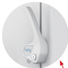
可单手操作的门把手机械锁，挂锁孔